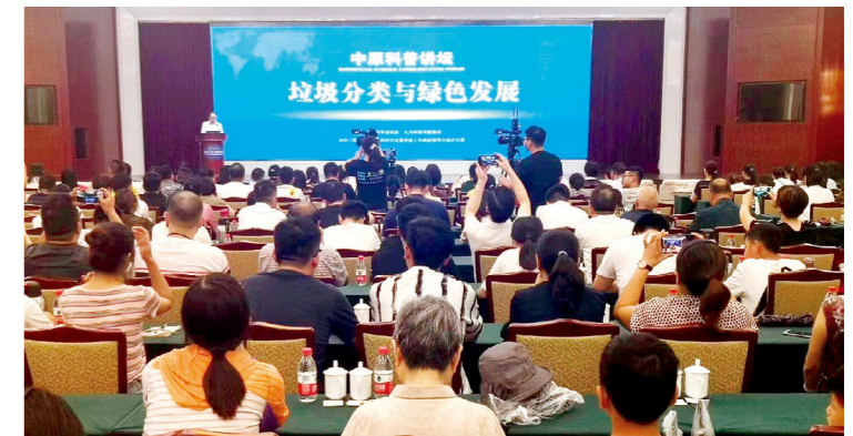
首期中原科普讲坛《垃圾分类与绿色发展》现场

为学习贯彻落实习近平总书记对垃圾分类工作重要指示精神，在全社会树立和传播垃圾分类理念，推动经济社会绿色发展和高质量发展，7月29日，省科协联合大河网络传媒集团共同举办以“践行垃圾分类，共建美丽河南”为主题的首期中原科普讲坛，中国工程院院士，环境工程专家，火箭军后勤科学技术研究所所长侯立安和环境工程专家、上海