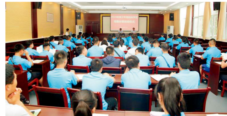
2019年青少年高校科学营河南省分营启动仪式现场

2019年青少年高校科学营活动由省科协、省教育厅共同主办，旨在发挥重点高校的科普资源优势，促进高等院校在科学普及和提高公众