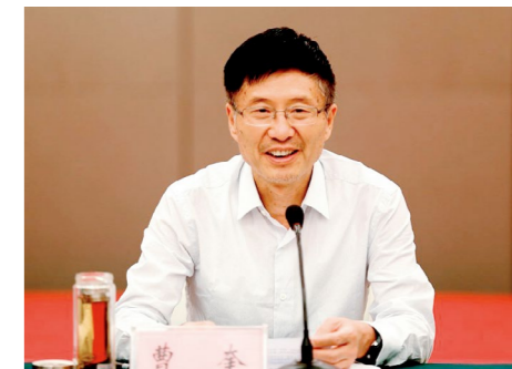
省科协党组书记、主席曹奎作报告

会议审议通过了曹奎所作的省科协年度工作进展情况报告。曹奎在报告中回顾总结了省科协今年以来的工作进展情况，强调要深入学习贯彻省委省政府和中国科协新部署新要求，贯彻落实喻红秋副书记调研指导科协工作时的讲话精神，坚持“有力有效、有声有色”总要求，以提升影响实效为主线，以打造品牌为重点，建载体、搭平台、创新体制机制，牢记初心使命，主动担当作为，全面完成年初工作部署，更好地联系、服务、凝聚全省广大科技工作者，为谱写中原更加出彩的绚丽篇章作出新贡献，以优异成绩庆祝新中国成立70周年。报告从六个方面对完成好今年各项工作进行了安排部署：以扎实开展主题教育为契机，全面加强科协系统党的领导和党的建设；以提升影响实效为导向，持续推进科协工作品牌建设；以科技志愿服务行动为旗帜，汇聚科协组织服务高质量发展的合力；以工程项目实施为抓手，推进重点工作部署落地落实；以办好重大活动为载体，增强科协工作参与度和影响力；以强化协同联动为着力点，汇聚科协工作高质量发展的合力。会议审议通过了关于接纳团体会员单位的提议，同意接纳省运筹学会、省微循环学会、省数字图形图像学会、省陶瓷学会、省计量测试学会等5家学会为省科协团体会员单位。会议审议通过了《河南省科学技术协会常务委员会工作规则（试行草案）》和《河南省科学技术协会常务委员会专委会工作机制（试行草案）》，将进一步推进省科协常委会工作制度化、规范化和程序化建设，为各专门委员会审议拟请常委会议审定的工作事项、对省科协未来工作进行前瞻性调查研究论证、对省科协现有工作提出意见建议、开展专题调研等提