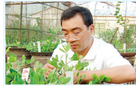
张新友从事花生杂交授粉

李俊贤，我国火箭推进剂创始人之一，聚氨酯工业奠基者之一，中国工程院院士，黎明化工研究设计院原院长兼总工程师。他默默投身科研近70载，开创了国内聚氨酯产业，为研制火箭和鱼雷推进剂作出了突出贡献。他一辈子勤俭节约，却捐赠毕生积蓄300万元设立博士创新基金和困难帮扶基金。他坚持爱党爱国，实践科技报国理想，用毕生努力实现了爱国之情、强国之志、报国之行相统一。中央主流媒体多次对李俊贤先进事迹进行了集中报道，被誉为“国家腾飞的推进剂”“国家精神的造就者”。