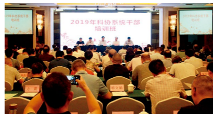
安徽省科协2019年科协系统干部培训班现场

7月16日至19日，安徽省科协在合肥举办2019年科协系统干部培训班。安徽省科协党组书记、副主席王洵出席开班式并作动员讲话，党组成员、副主席魏军锋主持开班式。新任市县级科协负责人、省科协“不忘初心、牢记使命”主题教育读书班人员和省科协机关及直属单位干部共120余人参加了培训。