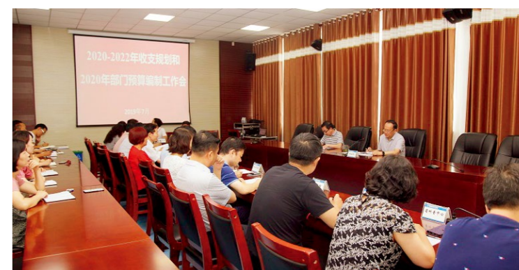
省科协2020—2022年收支规划和2020年部门预算编制工作会议现场

杨金河强调，面对财政收支规划编制新形势，省科协机关各部室和各直属事业单位要紧密结合省级财政收支规划编制工作新要求，紧密衔接科协《十三五规划》具体内容，扎实做好省科协2020—2022年收支规划编制和2020年部门预算编制工作，为科协各项事业发展提供有力保障。一是要高度重视、充分论证，确定规划编制工作实施内容；二是要认真组织实施，切实提升规划编制工作质量；三是要加强衔接配合，确保规划编制工作顺利完成。会议对2019年上半年预算执行情况进行了通报。