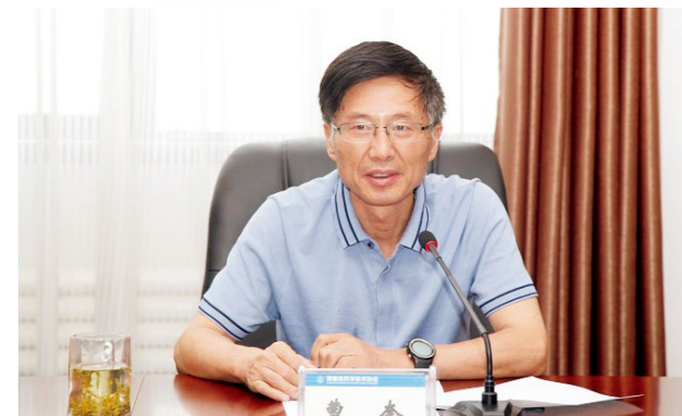
省科协党组书记、主席曹奎介绍“不忘初心、牢记使命”主题教育进展情况

7月9日，省科协党组书记、主席曹奎主持召开“不忘初心、牢记使命”主题教育检视问题座谈会，邀请全省学会代表、市县科协代表、高校科协代表、省科协九届委员代表，面对面听取科技工作者心声和意见，进