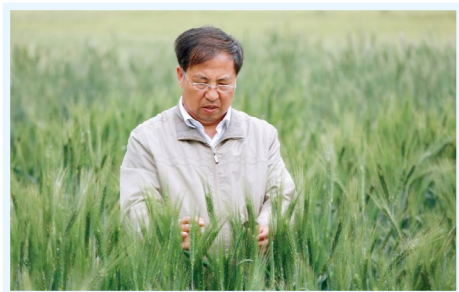
2015年茹振钢查看苗情

茹振钢，十九大代表，中原学者，享受国务院特殊津贴，河南省优秀专家，河南科技学院小麦中心(河南省杂交小麦技术工程中心)教授。他四十载辛勤耕耘，一直致力于小麦育种科研与教学工作，在小麦育种理论研究和品种创新方面取得了突出成绩，带领科研团队培育并推广了百农62、百农64、百农160、矮抗58等一系列小麦新品种，特别是矮抗58小麦新品种，荣获2013年度国家科技进步一等奖，截至目前累计种植面积3亿多亩，增产效益300多亿元，被农民朋友们亲切的誉为“粮财神”！