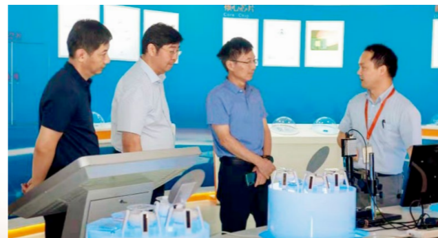
曹奎到鹤壁市看望慰问一线科技工作者

在河南仕佳光子科技股份有限公司、河南天海电器有限公司，曹奎一行仔细了解了企业生产运行、产品研发等情况，详细询问一线科技工作者工作生活情况。曹奎指出，科技创新是生产力也是竞争力，企业要以核心技术为支撑，助推企业走好集团化、规模化发展路子；要继续发挥科技引领作用，注重人才引进，积极与科研院所沟通对接；要努力在