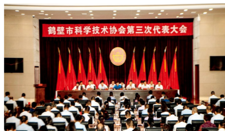
鹤壁市科学技术协会第三次代表大会召开

会议表彰了鹤壁市科协系统先进集体和先进工作者；审议通过鹤壁市科协第二届委员会工作报告、关于鹤壁市科协第二届委员会工作报告的决议；选举了鹤壁市