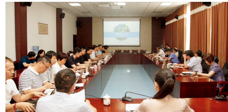
省科技馆新馆展教工程第一批招标项目中标单位汇报交流会现场

曹奎要求，中标单位要深入明确河南省科技馆的定位和定界，结合受众人群和科技馆前沿理论选取恰当的主线脉络；要强化复合型科技馆建设理念，从功能区分、发展趋势等多个角度确保新馆方案的整体性、科学性和教育性；要找准适合河南的特色科普资源，利用科技馆展品展项和教育活动的优势，讲好河南本土科学故事；要进一步做好空间设计，利用特色主题和热点专题进行科学传播；要