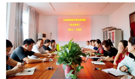
永城市科协文明礼仪知识讲座现场