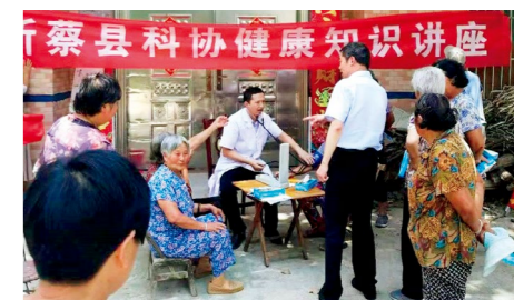
新蔡县科协在余庄村开展健康知识讲座