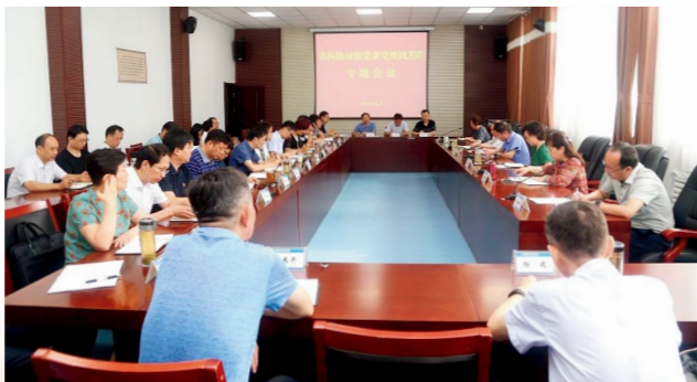
省科协对照党章党规找差距专题会议现场

主题教育开展以来，省科协领导班子成员认真学习《中国共产党党内重要法规汇编》，学习党章、准则、条例，坚