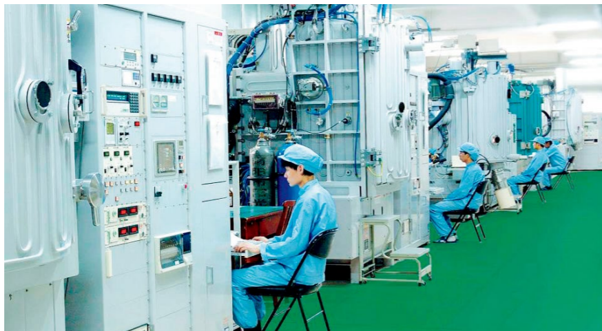
河南中光学集团有限公司RF离子源辅助成膜生产线

器生产线建设项目，创新采用机器人加工单元，将原本8道加工工序降为3道，每条生产线人工使用量由12-15人降为2-3人，生产效率提高了21%，能耗却降低了近10%；他们还采用了先进的超声波清洗设备，实现了节能降费、绿色环保。