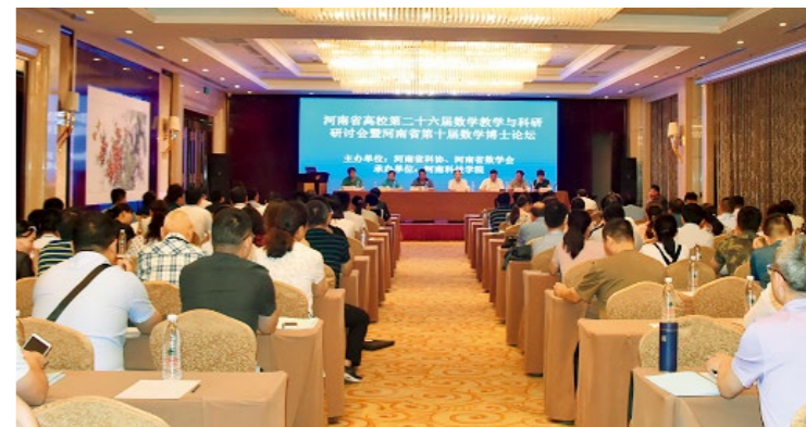
河南省高校第二十六届数学教学与科研研讨会暨河南省第十届数学博士论坛现场

与会期间，各位专家学者进行了深入交流，对我省数学学科领域的教学和科研水平的提高起