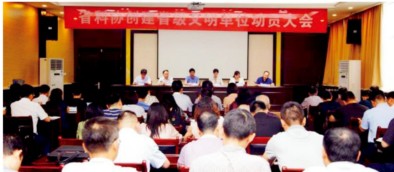
省科协创建省级文明单位动员大会会议现场