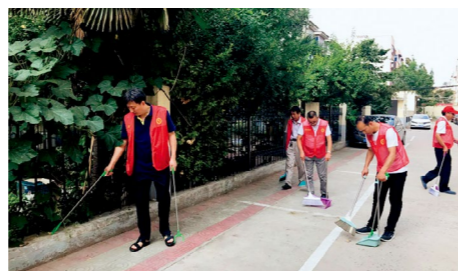
党员干部走上街头开展城市清洁行动