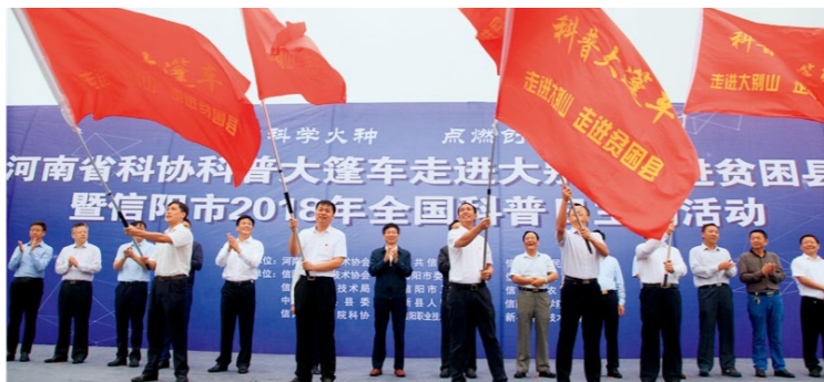
2018年9月15日至30日，省科协组织开展“科普大篷车走进大别山 走进贫困县”活动

省科协党组书记、主席曹奎在总结科普大篷车工作时指出，省科协科普大篷车走进大别山、走进伏牛山活动只是一个开始，今后，省