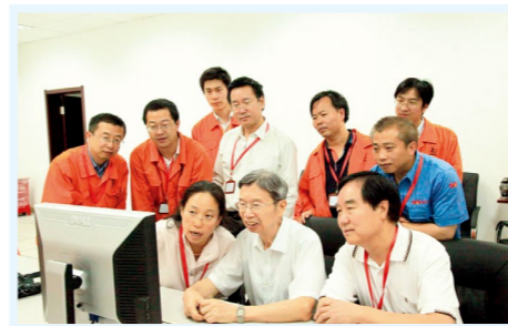
2010年10月，陈俊武（前排右二）在包头MTO现场

祁兴磊，泌阳县夏南牛研究推广中心农业技术推广研究员、河南省夏南牛工程技术研究中心主任。他带领科研团队潜心钻研，历时21年，主持育成了中国第一个拥有自主知识产权的肉牛品种——夏南牛，填补了我国肉牛育种的空白，开创了我国培育自己肉牛品种的先河，被誉为“夏南牛之父”。他淡泊名利，无私奉献，把现资产总额7000余万元的河南省夏南牛工程技术研究中心、国家级肉牛标准化规模养殖示范场——泌阳县夏南牛科技开发有限公司无偿捐献给泌阳县人民政府。他先后当选感动中原年度十大人物、2019年全国“最美科技工作者”，获得全国农业技术推广先进个人、全国先进工作者等多项荣誉称号。