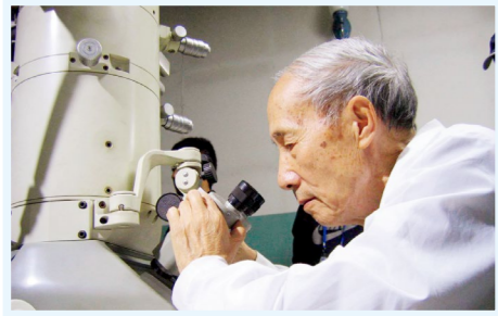
李俊贤在实验室进行科学研究

李俊贤，我国火箭推进剂创始人之一，聚氨酯工业奠基者之一，中国工程院院士，黎明化工研究设计院原院长兼总工程师。他默默投身科研近70载，开创了国内聚氨酯产业，为研制火箭和鱼雷推进剂作出了突出贡献。他一辈子勤俭节约，却捐赠毕生积蓄300万元设立博士创新基金和困难帮扶基金。他坚持爱党爱国，实践科技报国理想，用毕生努力实现了爱国之情、强国之志、报国之行相统一。中央主流媒体多次对李俊贤先进事迹进行了集中报道，被誉为“国家腾飞的推进剂”“国家精神的造就者”。