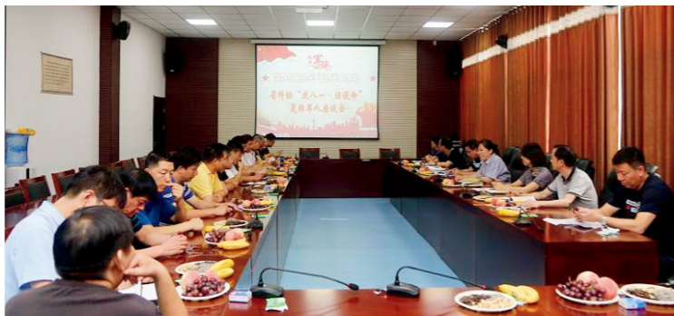
“庆八一·话使命”复转军人座谈会现场

饱满、热情高涨，分享难忘军旅故事，畅谈科协工作经历，纷纷感谢省科协党组的关心关怀，表示要坚守红色初心、不改军人本色，立足本职岗位、扎实勤勉工作，为推动科协事业创新发展再立新功、再创佳绩。