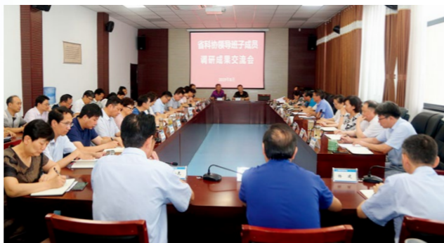
省科协召开主题教育调研成果交流会

会议强调，相关部门和单位要善始善终做好调研“后半篇文章”，把“改”字贯穿始终，真刀真枪地解决问题，大