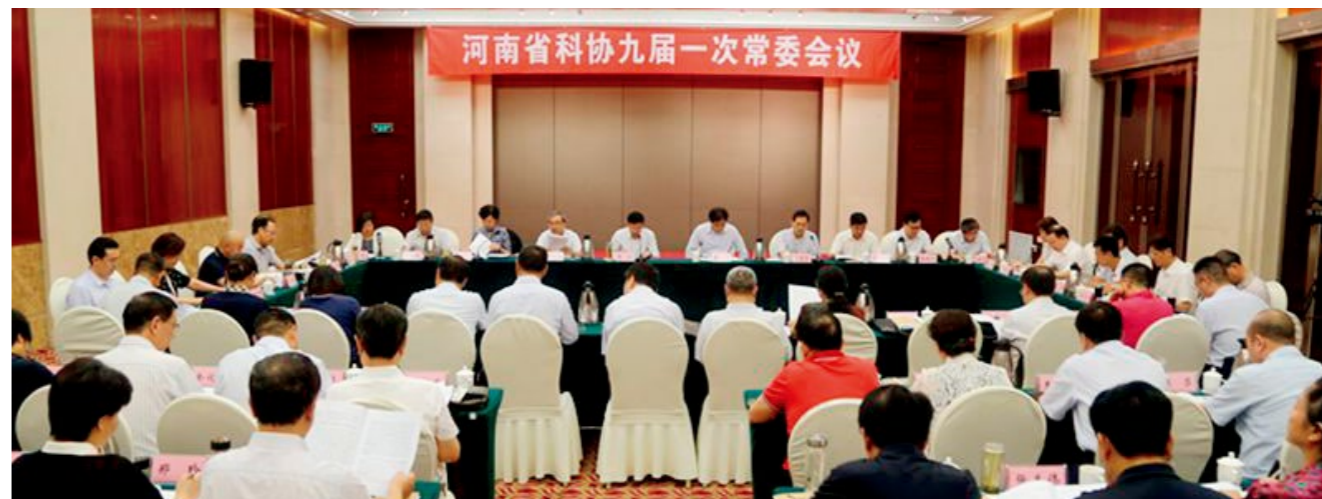
省科协召开九届一次常委会议