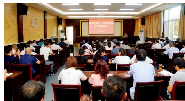
“身边党员话初心、牢记使命勇担当”分享交流会现场

大家一致认为，10名党员干部对标习近平新时代中国特色社会主义思想、党章党规等，从各自工作的实际出发，畅谈学习体会、工作感悟，使大家在学习中有收益、交流中有提高、工作中有借鉴、思路上有拓展。一致表示，要深入贯彻落实习近平新时代中国特色社会主义思想，认真学习身边党员恪尽职守、担当作为的敬业精神和淡泊名利、默默无闻