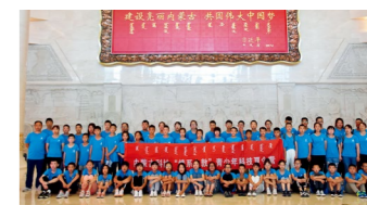
内蒙古科协“情系乌敦”青少年科技夏令营圆满落幕

7月31日，内蒙古科协“情系乌敦”青少年科技夏令营营员们游览大青山野生动物园、参观内蒙古博物院，为此次研学之旅画上了圆满的句号。