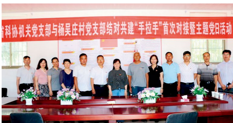
省科协机关党支部与杨吴庄村党支部开展结对共建“手拉手”活动

结对共建“手拉手”活动是省科协深入开展“不忘初心、牢记使命”主题教育，履行“四服务”职责、践行初心使命的重要抓手，