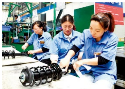
浙减公司生产的汽车减震器产品相继进入世界一流汽车厂家的全球采购配套体系

在西峡县瑞发电气集团，新上马的防爆电机生产线项目让人眼前一亮。该项目产品技术高端，市场前景广阔，综合效益显著。一期项目今年3月份投产，预计每年可实现销售收入2亿元，利税6800万元；二期项目今年5月份已开工，两年内即可建成，又能为企业新增产值6亿元。同样在该县，众德汽车部件有限公司年产20万只车桥及涡轮增压